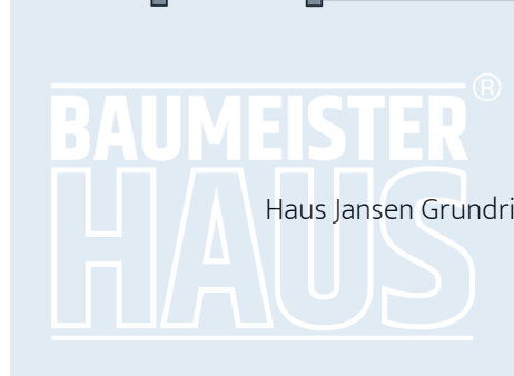
Haus Jansen Grundriss