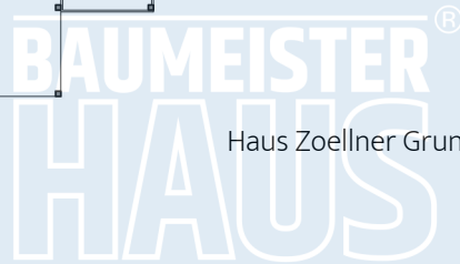
Haus Zoellner Grundriss