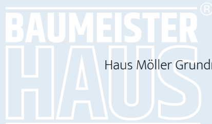
Haus Möller Grundriss