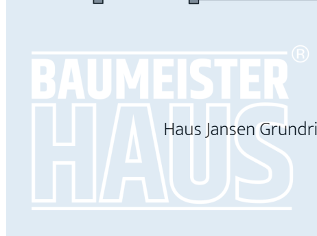
Haus Jansen Grundriss