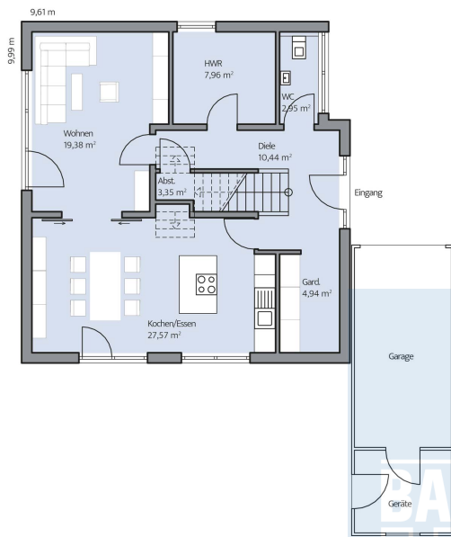
Haus Daniel Grundriss